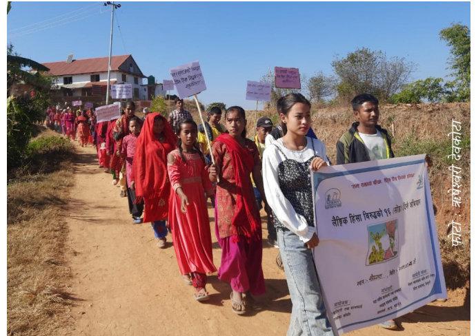
लैङ्गिक हिंसा विरुद्धको सोह्र दिने अभियानका क्रममा आयोजित च्याली

यसैगरी यो अभियान अन्तर्गत नेवा गण्डकी प्रदेश कार्यालय, बागलुङ अन्तर्गत बागलुङ जिल्लाको ताराखोला गाउँपालिका-१ को माभखर्क, बडीगाड गाउँपालिका-१ को म्यालडाँडा र तमानखोला गाउँपालिका-५ तथा म्याग्दी जिल्लाको धवलागिरी गाउँपालिका-५ का भेडीखाल्टा