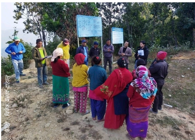
कार्य - विवेक भण्डार, बाहल

यसैगरी परिषदले यही पुष ११ देखि १५ गते सम्म सिन्धुली जिल्लाको गोलज्वर गाउँपालिका - ४ मा सम्पन्न रानीखोला खानेपानी तथा सरसफाइ आयोजना, दुधौली नगरपालिका - १४ मा सम्पन्न झौंकीटार खानेपानी तथा सरसफाइ आयोजना र कमलामाई नगरपालिका - १२ मा सम्पन्न भण्डारखोला खानेपानी तथा सरसफाइ आयोजनाको अनुगमन गरेको थियो।