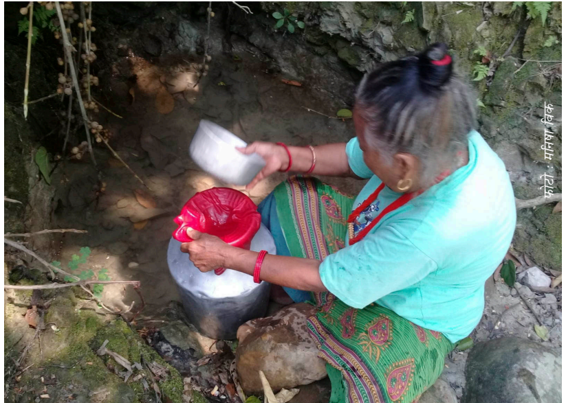
गाउँमा पानीको सुविधा नहुँदा कुवाबाट पानी भर्दै बाटुमाया

खानेपानीको यस्तो विकराल समस्याले यस क्षेत्रका वासिन्दालाई कहिल्यै पनि गरीबीको कुचक्रबाट उम्कन दिएको थिएन । खेतीपाती लगायतका अरु काम गर्नु पर्ने समयमा पानी भर्नेका लागि गर्नु पर्ने मेहेनतले गर्दा उनीहरूले अरु केही पनि सोच्न पाएका थिएनन् । उनीहरूको धेरैजसो समय र शक्ति पानी भर्नेमा सकिन्थ्यो ।