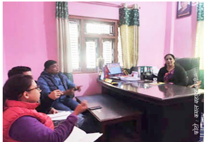
बडिगाड गाउँपालिकाका अध्यक्षसँग छलफल गर्दै अनुगमन टोलीका सदस्यहरू

नेपालमा कार्यरत सामाजिक संस्थाहरूको कामको अनुगमन तथा मूल्याङ्कन गर्ने संस्था समाज कल्याण परिषदले आ.व. २०७६/०७७ मा नेवाका प्रदेश कार्यालयहरू अन्तर्गत बागलुङ र सिन्धुली जिल्लामा निर्मित खानेपानी तथा सरसफाइ आयोजनाहरूको अनुगमन तथा मूल्याङ्कन गरेको छ। यस क्रममा यही पुष १ देखि ३ गतेसम्म बागलुङ जिल्लाको निसीखोला गाँउपालिका - ६ मा निर्मित मलोहा, बराह, पाडार भार्कवाड तथा बडिगाड गाउँपालिका - ९ मा निर्मित बल्घास मैदाले खानेपानी तथा सरसफाइ योजनाहरूको स्थलगत अनुगमन गरिएको थियो। अनुगमन टोलीले आयोजनामा निर्माण भएका मुहान, ट्याङ्की तथा धाराहरूको निरीक्षणका साथै उपभोक्ता समितिहरूका पदाधिकारीहरूसँग छलफल गरेको थियो। अनुगमनका क्रममा सो टोलीले आयोजना निर्माणपछि उपभोक्ताहरूले पाएको सहजता र त्यसबाट उनीहरूको दिनचर्यामा आएको परिवर्तन, आयोजनाको मर्मत सम्भार योजना, मर्मत सम्भार कोष, आयोजना दिगो राख्न गरिएको सोच तथा सरसफाइको अवस्थाबारे जानकारी लिएको थियो। यसैगरी अनुगमन टोलीले खानेपानी तथा सरसफाइ आयोजनाहरू सञ्चालन भएको बडिगाड गाउँपालिकाका पदाधिकारीहरूसँग पनि आयोजनाका