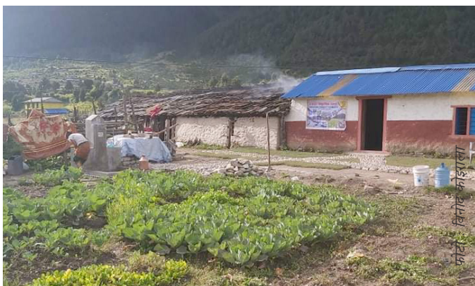
होम स्टे संचालकहरूले गरेको तरकारी खेती

केही समयअघिसम्म ढोरपाटन क्षेत्रका वासिन्दाहरू खानेपानीका लागि नजिकैको खोला धाउन बाध्य थिए। पानीको अभावले उनीहरू मात्र नभई पर्यटकहरूले समेत धेरै असजिलो परिस्थितिको सामना