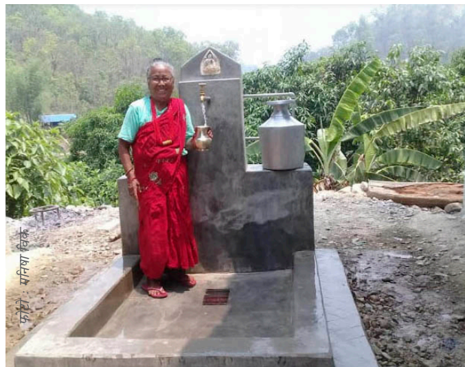
आँगनको धारामा बाटुमायाको अनुहारमा छर्चल्किएको खुशी

यस गाउँका मानिसहरू भालेको डाकोसँगै डोकोमा प्रागी र हातमा लाल्टिन बोकेर आधा घण्टा धाएर कुवामा पुग्थे । कुवामा पुग्ने बित्तिकै पानी भर्न पाइने होइन, पालो कुर्दाकुर्दै पानी लिएर घर पुग्दा घाम शिरमाथि चढिसकेको हुन्थ्यो । समय र शक्तिजति पानी भर्दाभर्दै सकिएपछि घरको बाँकी काम गर्ने समय नै रहँदैनथ्यो । कामको बोभले थिचेर खानपीनको पनि टुक्को हुँदैन थियो । मेलापात, घाँसदाउरा, गोठालो, हाटबजार जहाँ गए पनि पानीको चिन्ता मनभरि हुन्थ्यो । सबै काम सकेर लखतरान भएर साँझ घर फर्कँदा रित्तो गाग्री लडिरहेको हुन्थ्यो । अनि फेरि डोकोमा गाग्री बोकेर पँधेरा धाउनु पर्ने बाध्यताले साँझ बिहान छाड्दैनथ्यो । यहाँका वासिन्दालाई जीवन भनेको नै गाग्री बोकेर घर र पँधेर बीचको हिँडाई जस्तो भएको थियो ।