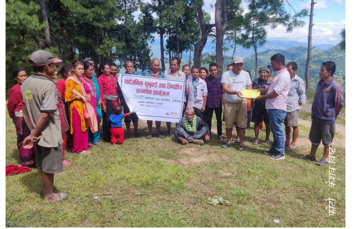
समुदायमा सञ्चालित सार्वजनिक सुनुवाईको एक दृष्य

आयोजनाका सबै क्रियाकलाप सम्पन्न भए लगत्तै पुनः सार्वजनिक